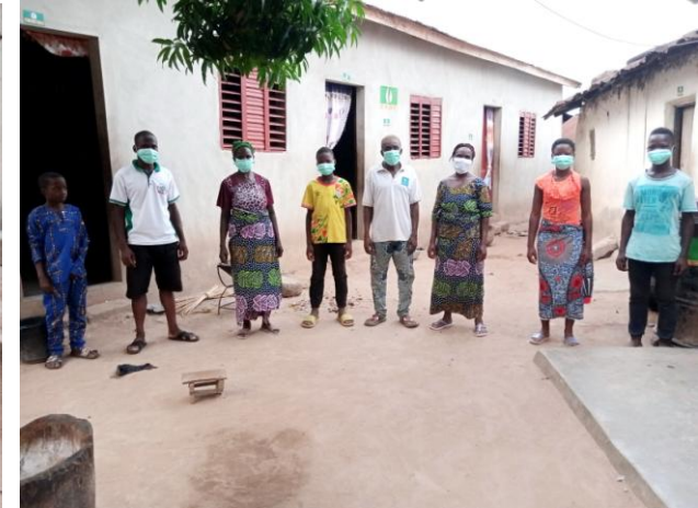
Finanzierung von über 5.000 Gesichtsmasken gegen das Coronavirus